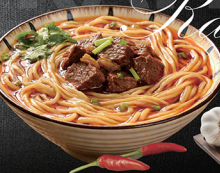
R1 00 Rindfleisch-Ramen 牛肉豚骨ラーメン € 13,90